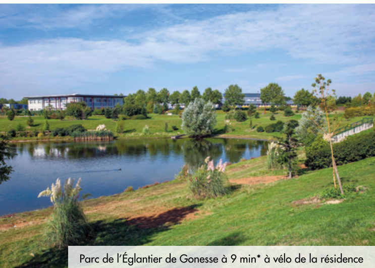
Parc de l'Églantier de Gonesse à 9 min* à vélo de la résidence