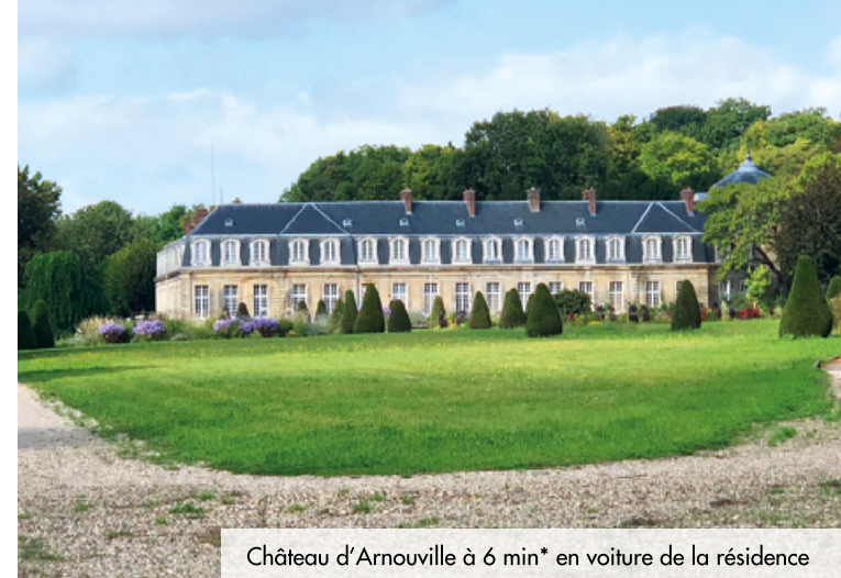
Château d'Arnouville à 6 min* en voiture de la résidence

Au sein de la communauté d'agglomération de Roissy Pays de France, Arnouville est située à l'extrême sud-est du Val-d'Oise, à 19 km* du centre de Paris et à 14 km* de la Porte de la Chapelle. Principalement résidentielle, la ville offre un cadre de vie paisible, idéal pour les familles. Dans un environnement fleuri, elle compte trois monuments historiques, dont un château du XVIII e , et propose de nombreuses activités culturelles et sportives au travers d'une quarantaine d'associations.