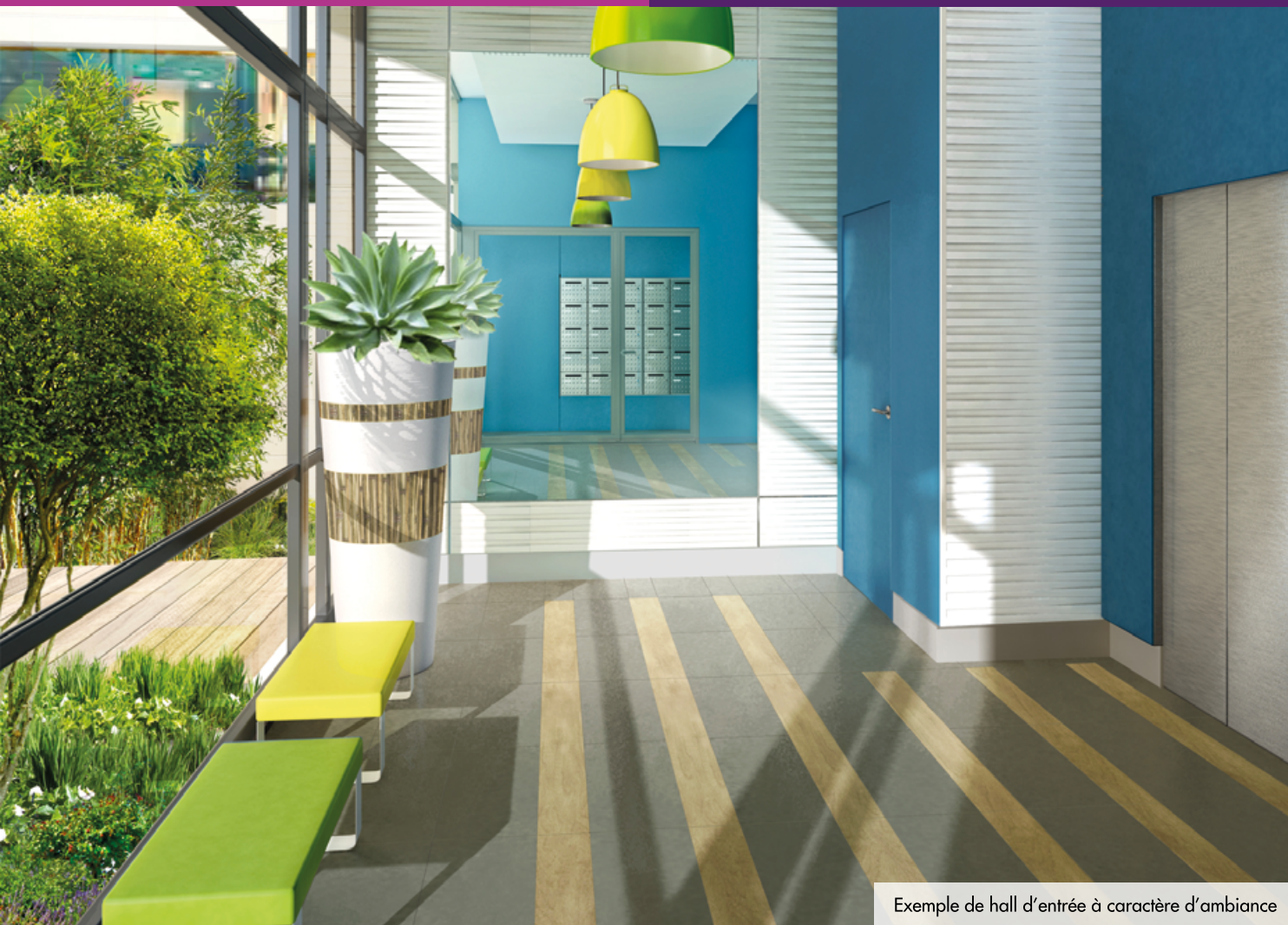
Exemple de hall d'entrée à caractère d'ambiance