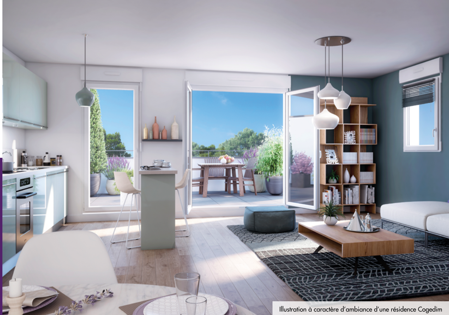
Illustration à caractère d'ambiance d'une résidence Cogedim