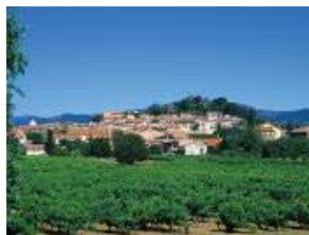
Cogolin, l'esprit village entouré de nature