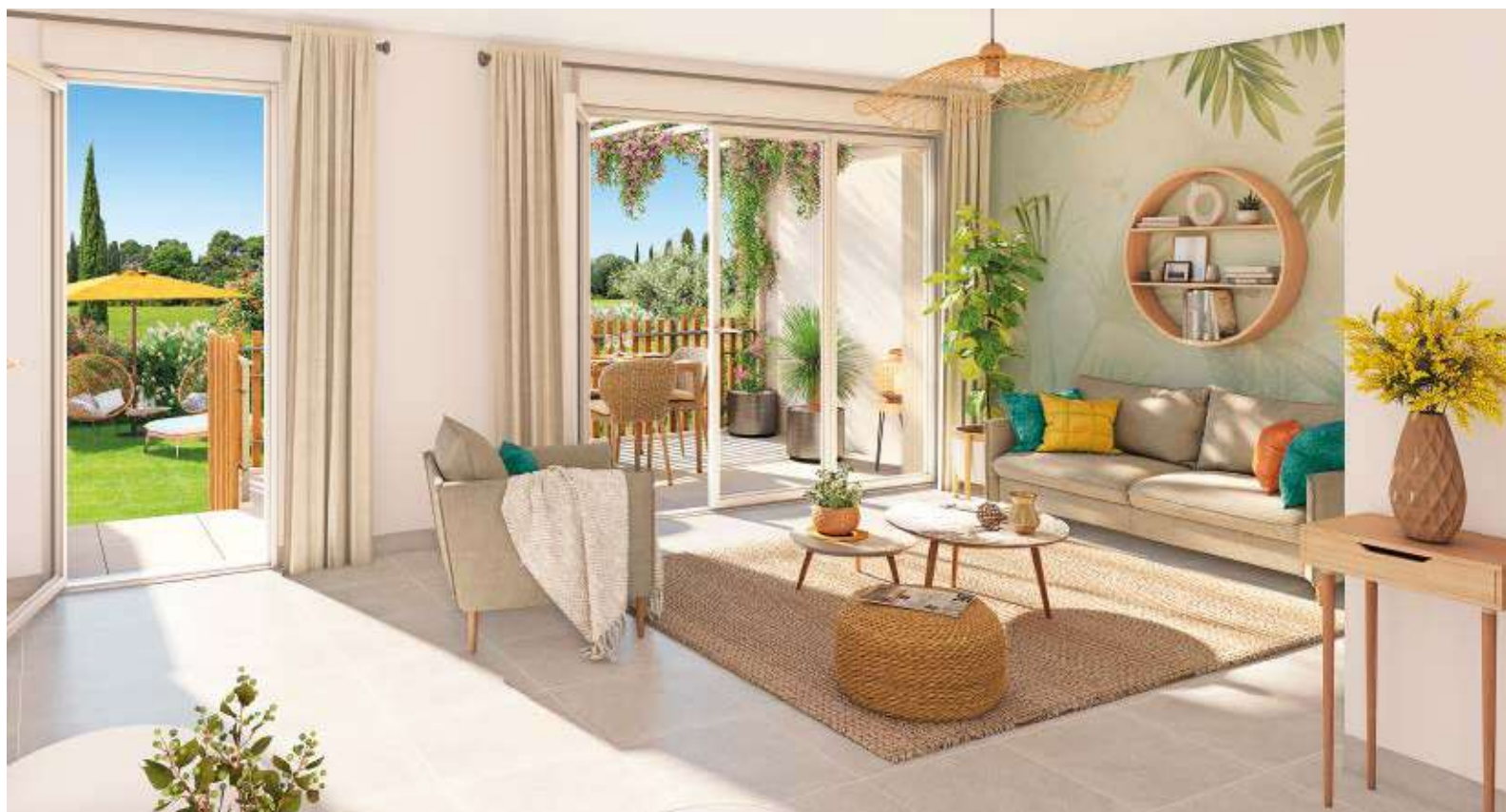
Illustration non contractuelle à caractère d'ambiance d'une opération Cogedim