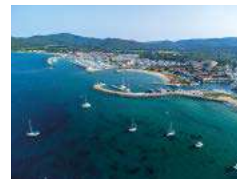
Port-Cogolin, le charme balnéaire