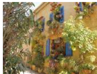
Le cœur du village historique de Cogolin à 15 minutes* à pied