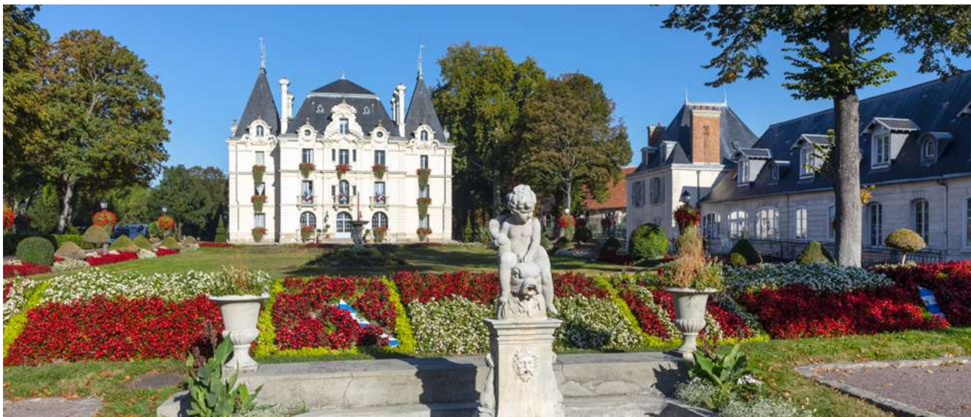
Parc de l'Hôtel de Ville

À seulement 16 km* de Paris, Chilly-Mazarin s'illustre par ses charmes restés intacts et la qualité de son art de vivre.