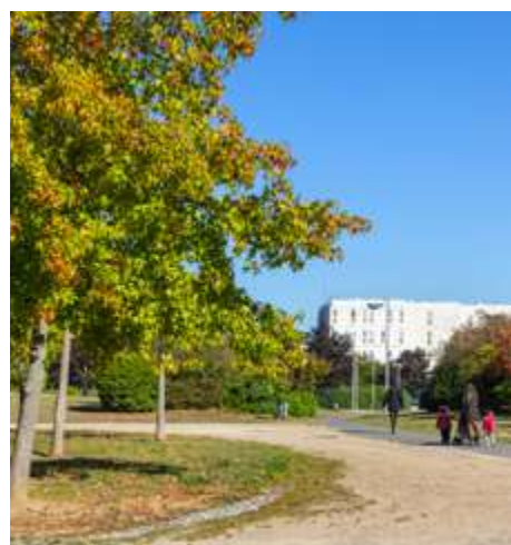
Parc des Champs-Foux