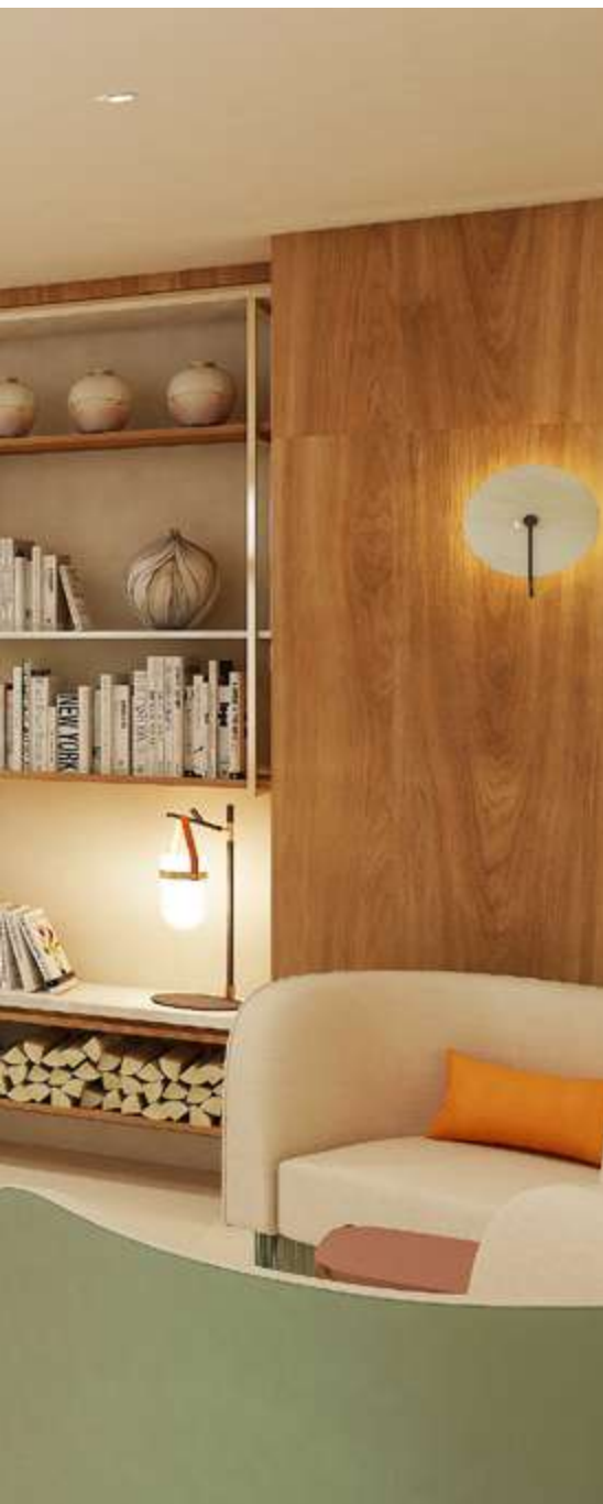
Exemple d'ambiance COGEDIM Club®