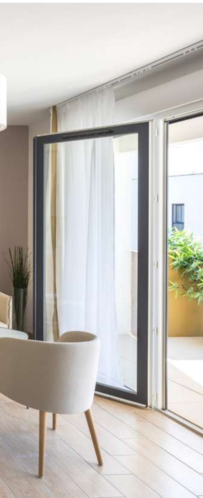
Exemple d'intérieur COGEDIM Club® à Lyon 7°

Les intérieurs se veulent particulièrement lumineux grâce aux larges baies vitrées qui diffusent la lumière naturelle. Tous les appartements disposent d'un bel espace extérieur prolongeant la pièce à vivre et permettant de profiter de moments privilégiés.