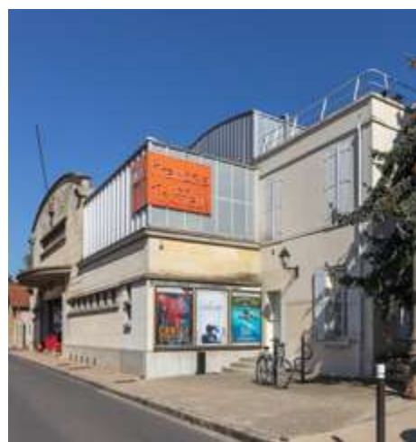
Cinéma François Truffaut