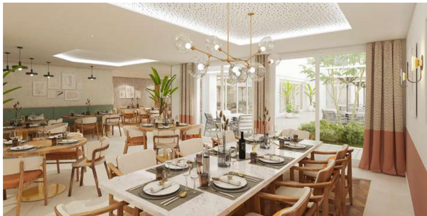
Exemple d'ambiance COGEDIM Club®

Une restauration qualitative soigneusement sélectionnée et adaptée aux besoins de chacun sera proposée avec également des repas à thème en fonction des saisons et des animations.