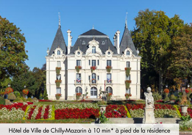
Hôtel de Ville de Chilly-Mazarin à 10 min* à pied de la résidence