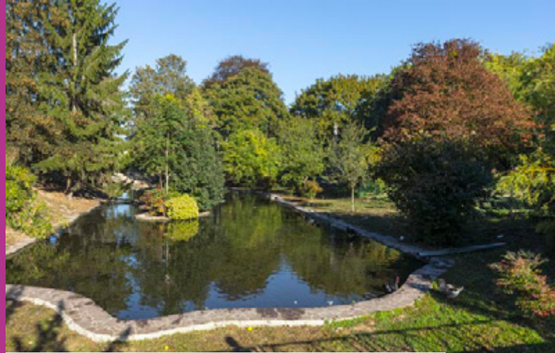
Parc des Champs-Foux à 4 min* à vélo de la résidence