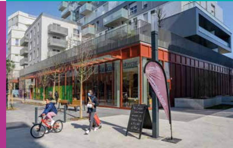
Le centre-ville piéton et commerçant à 6 minutes* à pied de la résidence