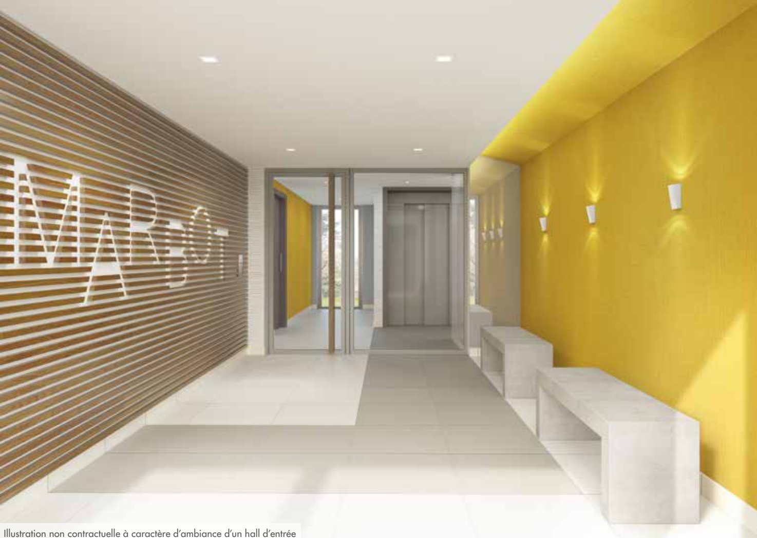
Illustration non contractuelle à caractère d'ambiance d'un hall d'entrée