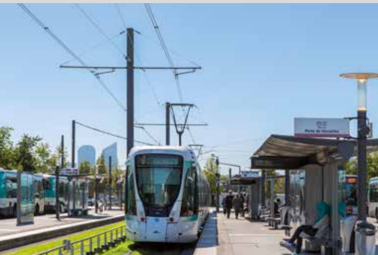
Le tramway T2 Pont de Bezons à 15 min* de la résidence