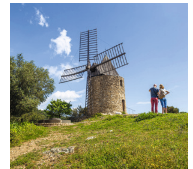
Le moulin St-Roch à 600 m*