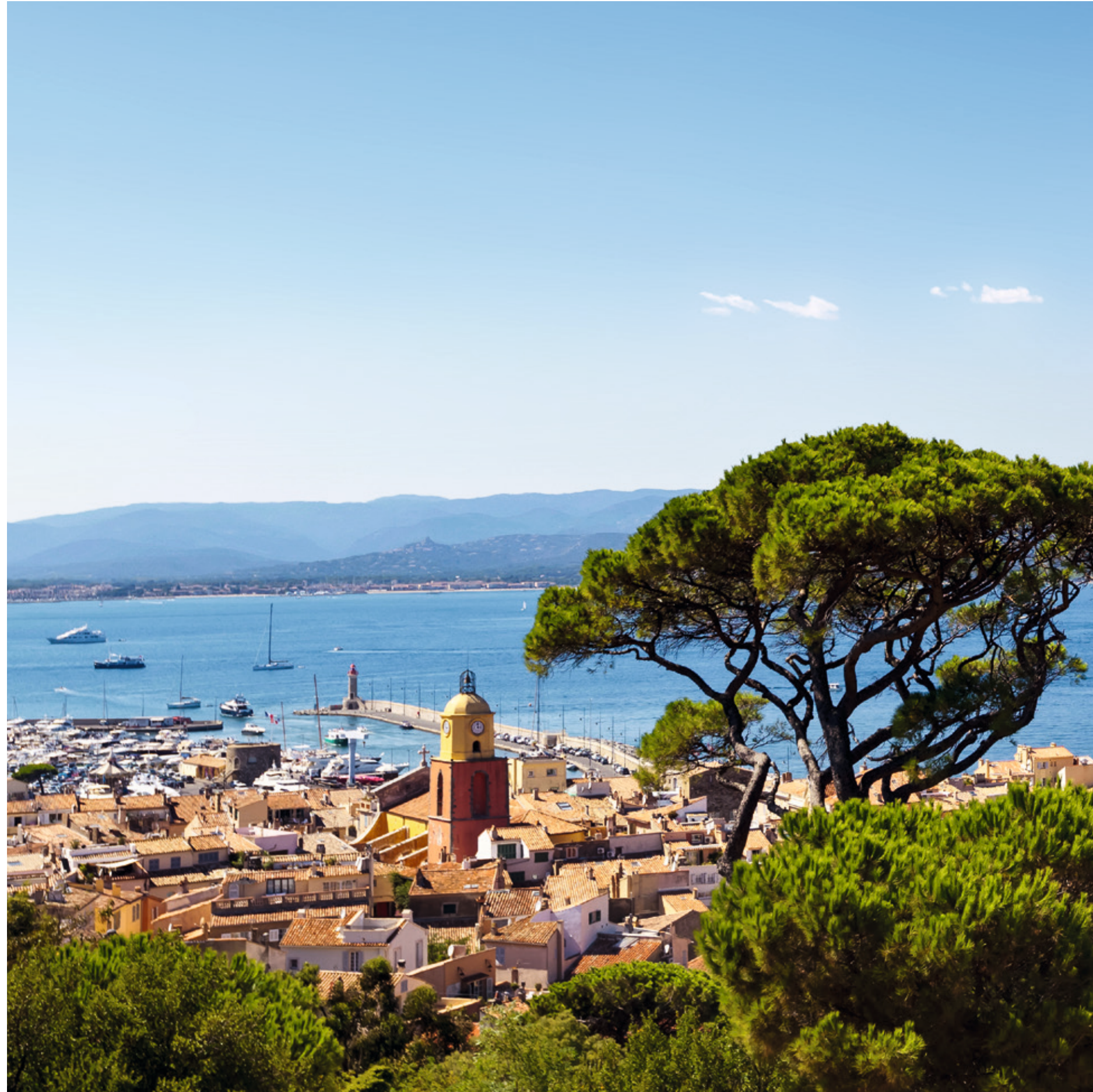
Saint-Tropez et Grimaud, deux villages en face à face sur le golfe