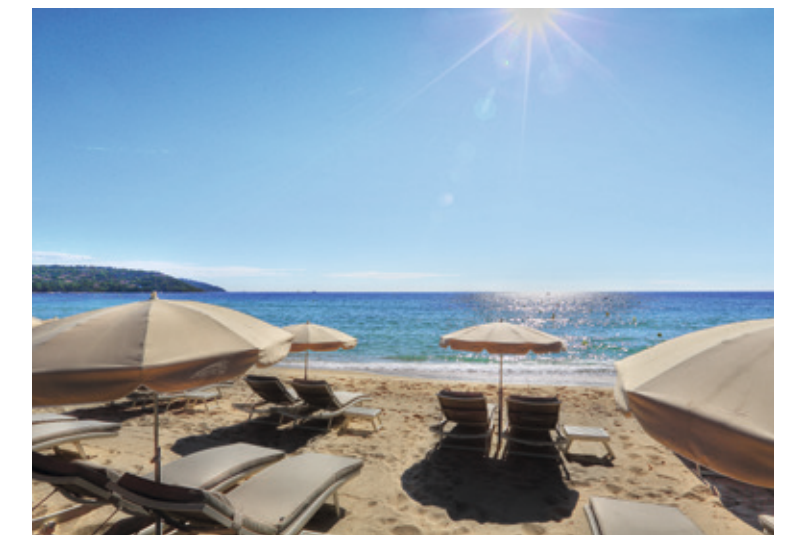
Le Golfe de Saint-Tropez et ses célèbres plages de sable fin...