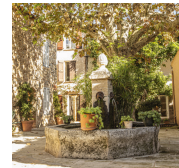
Le cœur authentique de Grimaud à 200 m*