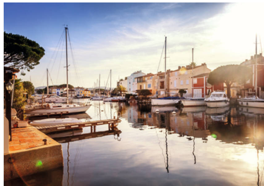
Port-Grimaud, la petite Venise Provençale

Passé le cœur historique, place à la nature exaltée des collines varoises et à leurs chemins et promenades aux accents pagnolesques. Ô combien romantiques, les vestiges du pont des fées, ancien aqueduc qui a sauvé le village de sa sécheresse, évoqueront pour certains une espèce de tortue, pour d'autres le riche folklore des légendes provençales.