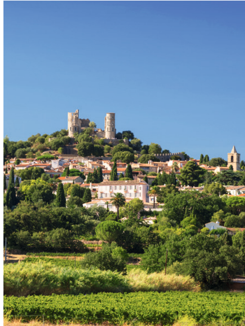
Sentinelle médiévale, le château de Grimaud face à la mer