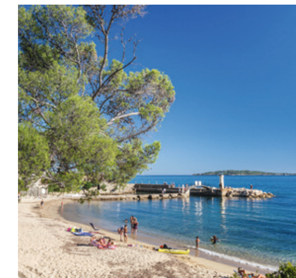
Criques et plages de sable fin à 10 min* en voiture