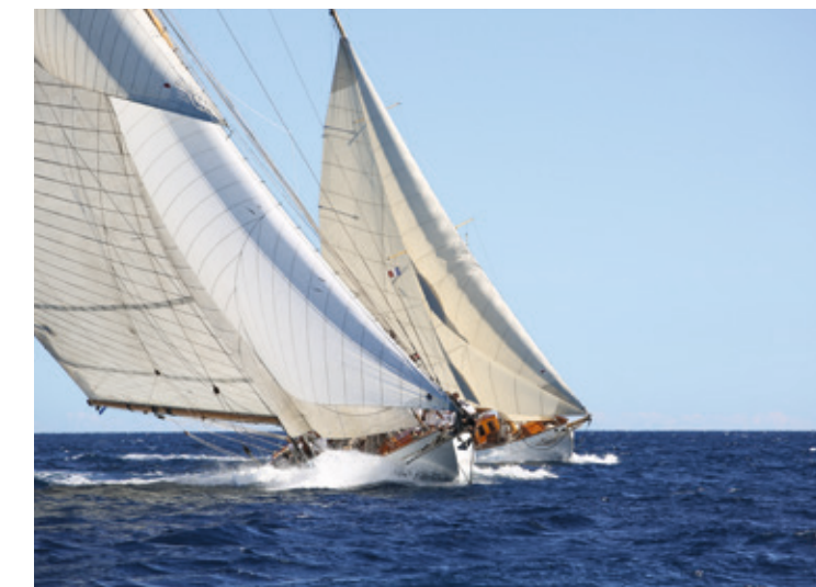
"Les Voiles de Saint-Tropez", le rendez-vous du yachting international

Si la presqu'île concentre les grands rendez-vous internationaux, les palaces les plus en vue, les terrasses mythiques, comme celle du Sénéquier, en plongeant au cœur du Golfe l'ambiance se fait plus discrète, le luxe devient feutré, les plages plus sauvages. C'est sur ce versant intime du Golfe le plus célèbre de France que Grimaud-l'authentique cultive son raffinement.