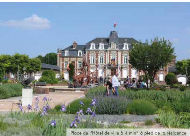
Place de l'Hôtel de ville à 4 min* à pied de la résidence

À 17 km* de Rouen, Saint-Aubin-Lès-Elbeuf est une commune familiale prisée pour son cadre de vie agréable et fleuri. Tout en profitant de la dynamique de la capitale normande et de ses bassins d'emplois, elle distille un art de vivre paisible et dispose de l'ensemble des équipements et infrastructures pour satisfaire ses habitants.