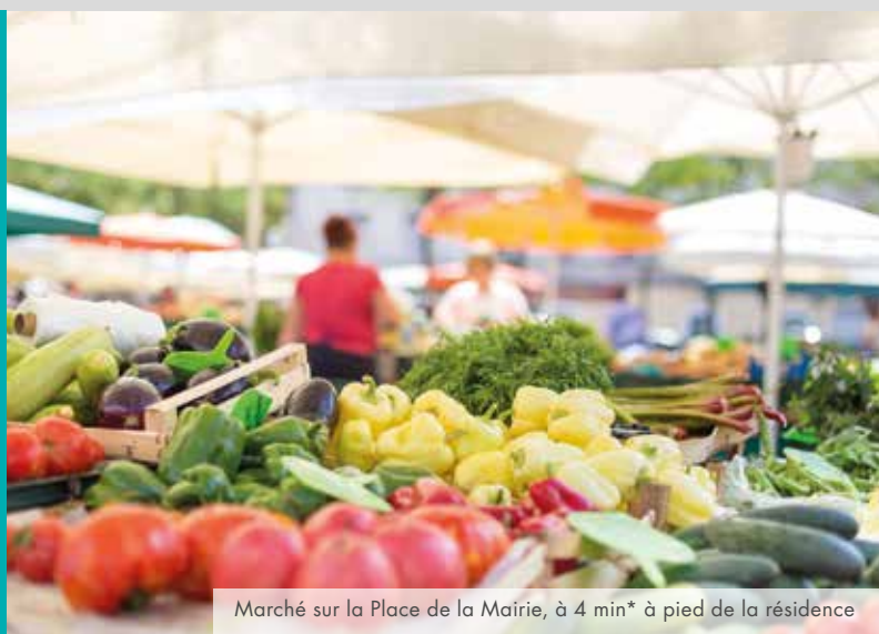
Marché sur la Place de la Mairie, à 4 min* à pied de la résidence