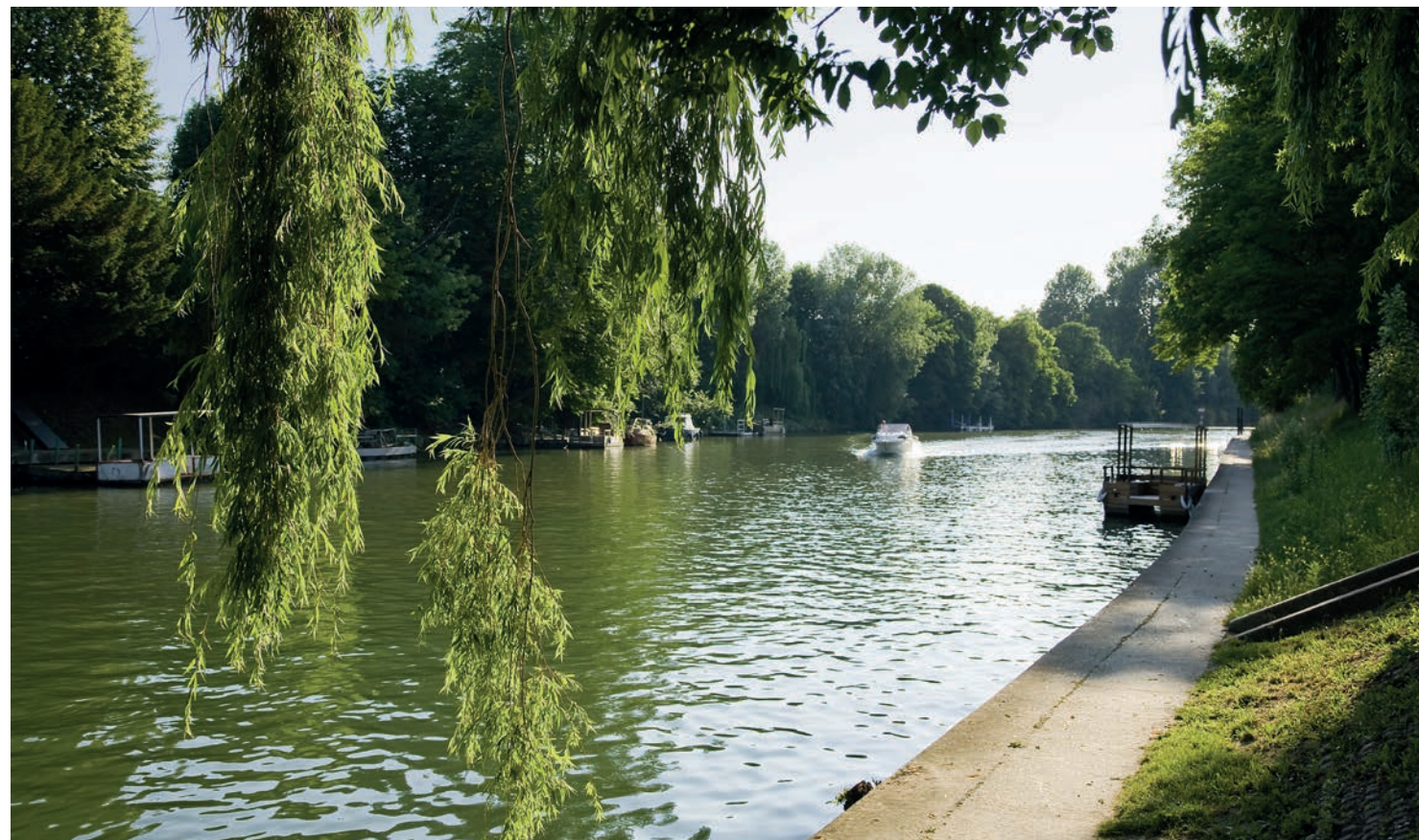
Bords de Marne à 6 min* à vélo de la résidence

Entre ville et nature, Le Perreux-sur-Marne a su trouver un équilibre parfait à deux pas de la capitale.