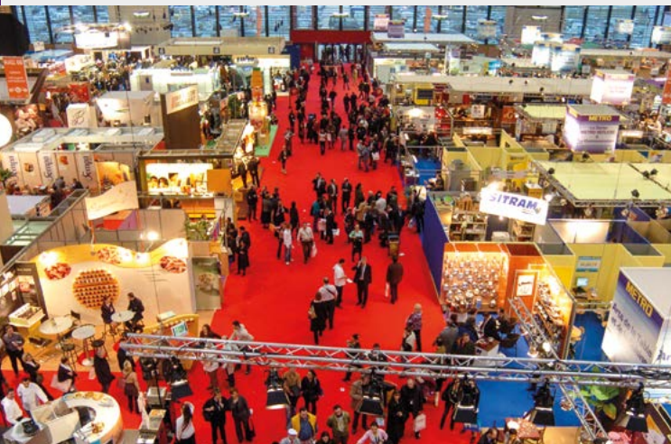
Le Parc Eurexpo accueille entre 50 et 60 salons par an.