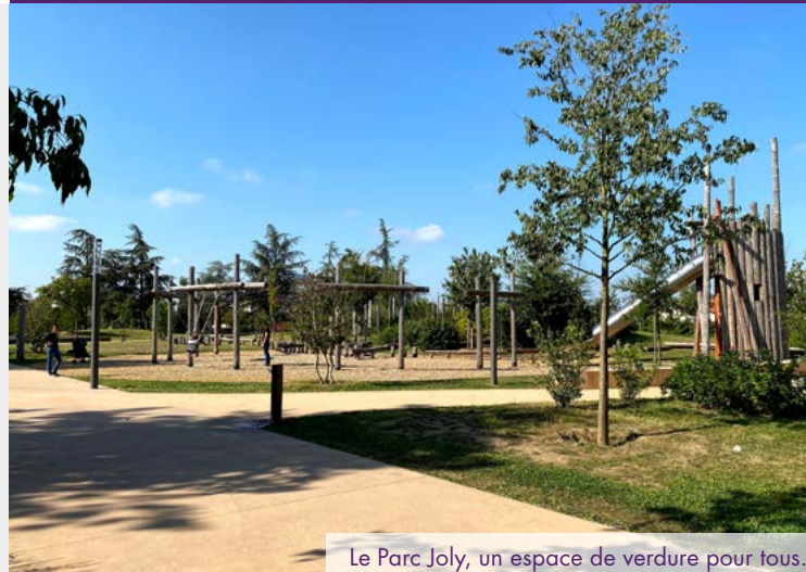
Le Parc Joly, un espace de verdure pour tous.