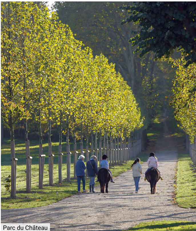
Parc du Château