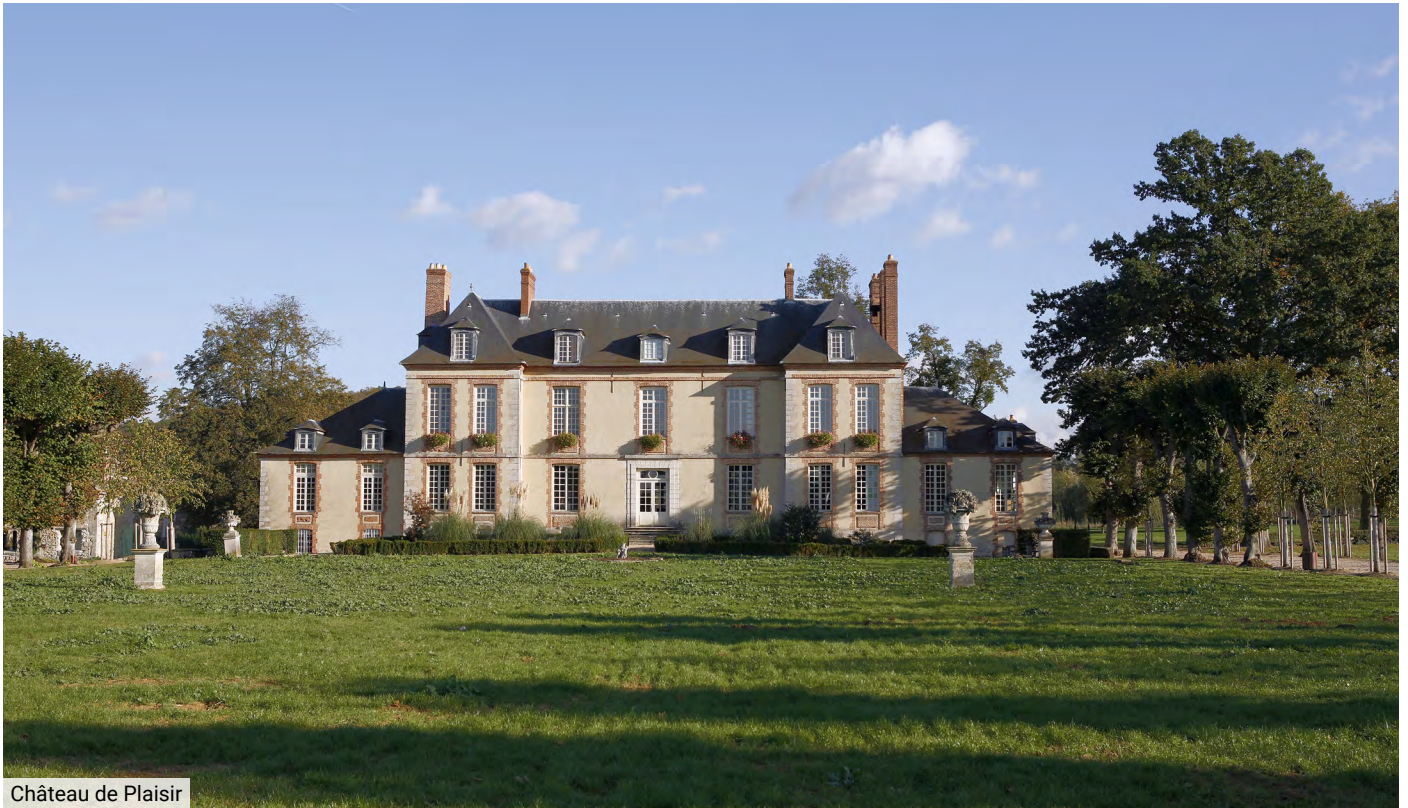
Château de Plaisir