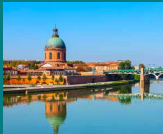
Hôpital de la Grave à Toulouse

À seulement 10 minutes à l'ouest de Toulouse et de son effervescence urbaine, Colomiers est une agréable commune de 39 000 habitants* prisée pour son calme et sa qualité de vie. Généreuse et ensoleillée, la ville se dote de beaux espaces verts et d'une grande richesse associative. Une vitalité locale également visible dans les infrastructures culturelles et sportives proposées aux habitants. Avec de nombreux commerces, un système éducatif complet et un réseau de transports en commun performant, la ville de Colomiers joue la carte de la proximité et de la mobilité. L'activité économique s'articule quant à elle autour de grands noms de l'aéronautique (Bréguet, Dassault, Airbus Group...) présents sur le territoire. Un vaste bassin d'emplois synonyme de belles opportunités professionnelles.