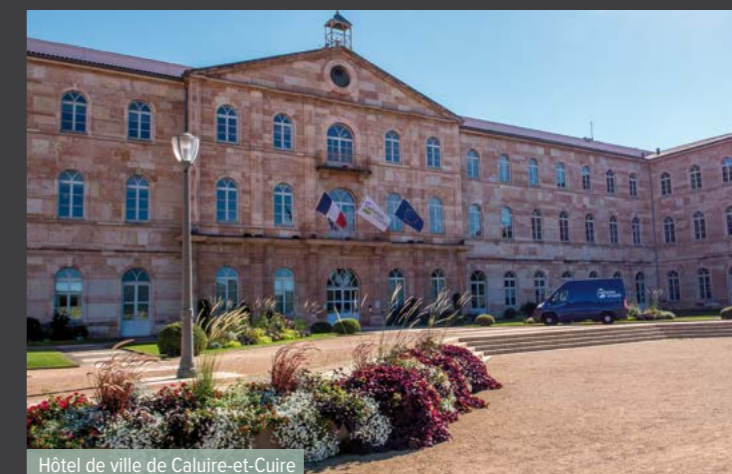
Hôtel de ville de Caluire-et-Cuire