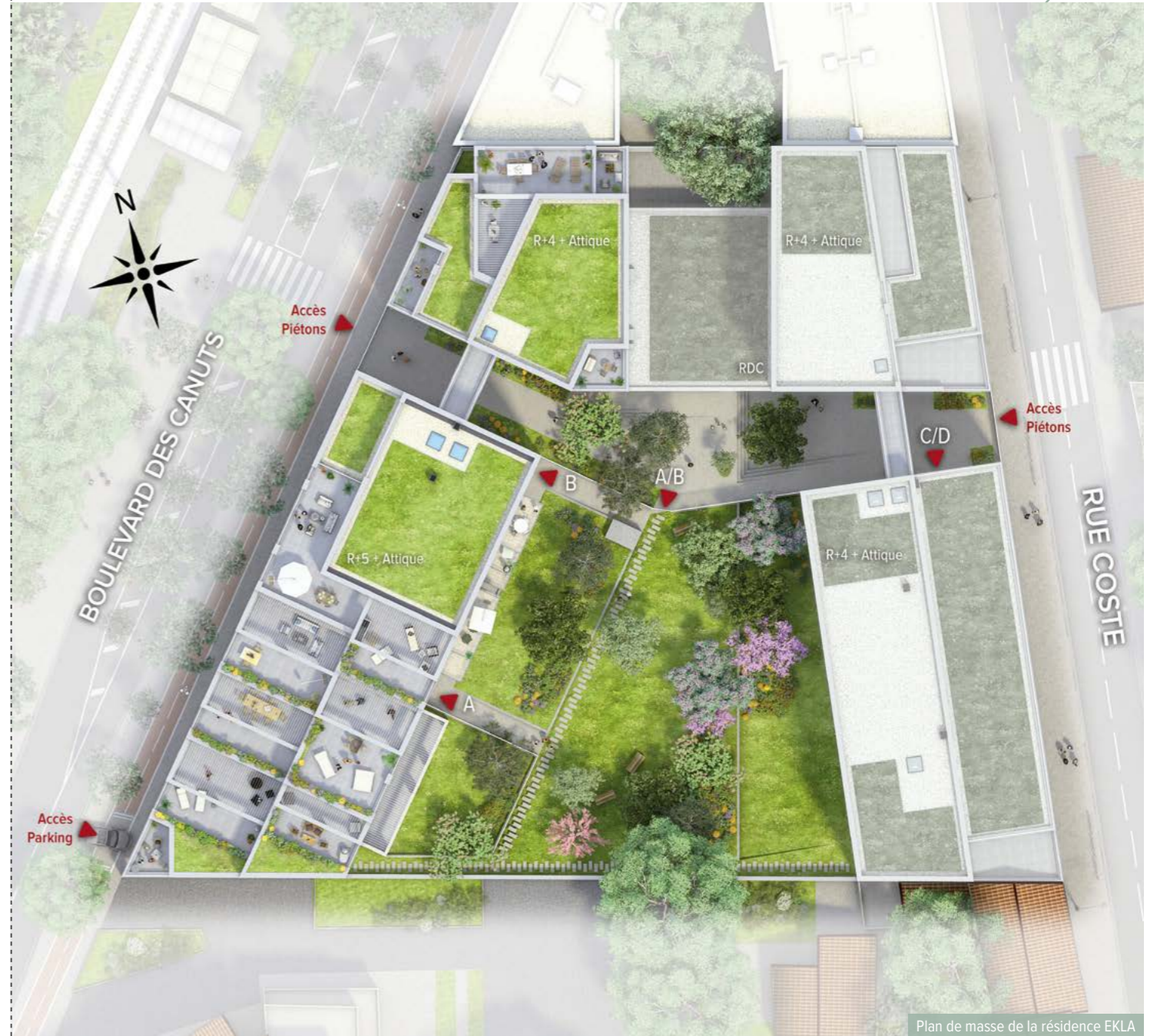
Plan de masse de la résidence EKLA

plantations. Élevés sur 5 et 6 étages, les immeubles jouent sur une architecture rythmée aux lignes épurées. Briques de parement de teinte claire, toitures végétalisées et jardin arboré signent un dialogue équilibré entre ville et nature. Ouverte sur l'horizon, EKLA révèle une vue sur les collines des Monts d'Or et la métropole lyonnaise.