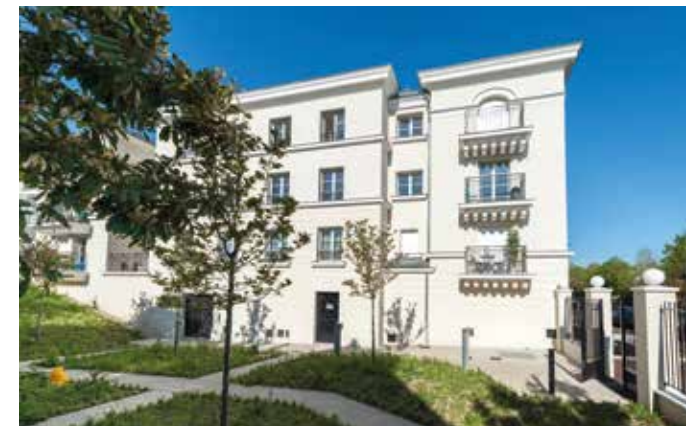
Le VI - Reuil-Malmaison