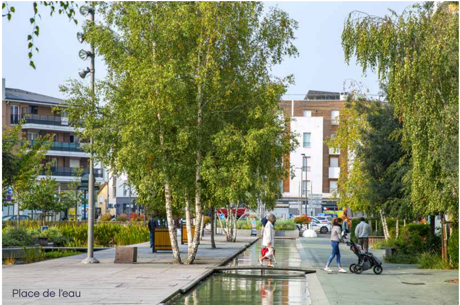
Place de l'eau