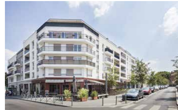
Carré Renaissance II - Noisy-le-Grand