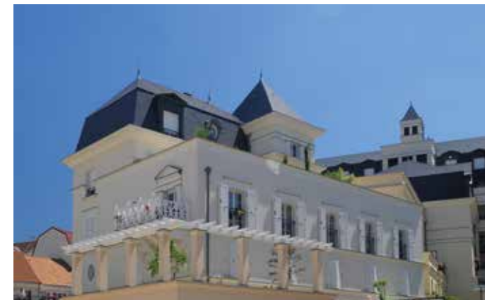
Palais Colbert - Le Plessis Robinson