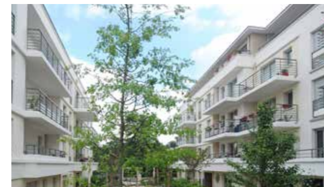
Les Jardins de Noisiel à Noisiel (77) Architecte : Atelier GERA