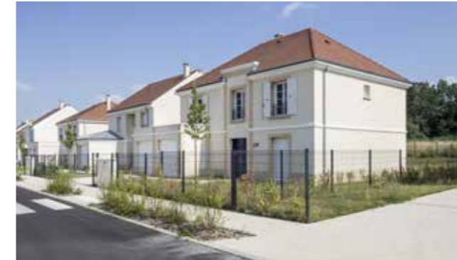
Domaine de l'Orangerie à Montevrain (77) Architectes : Emmanuel Gutel et Paul Meyer