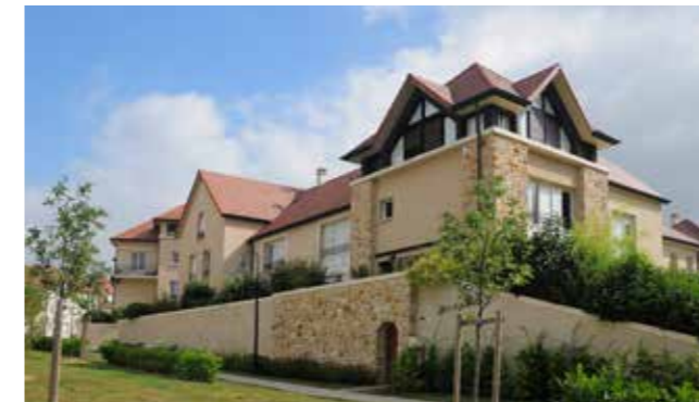
Chessy Village à Chessy (77) Architecte : Lionel de Segonzac