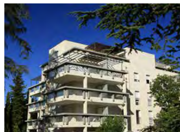
Le Domaine des Grands Cèdres - Marseille 10 e