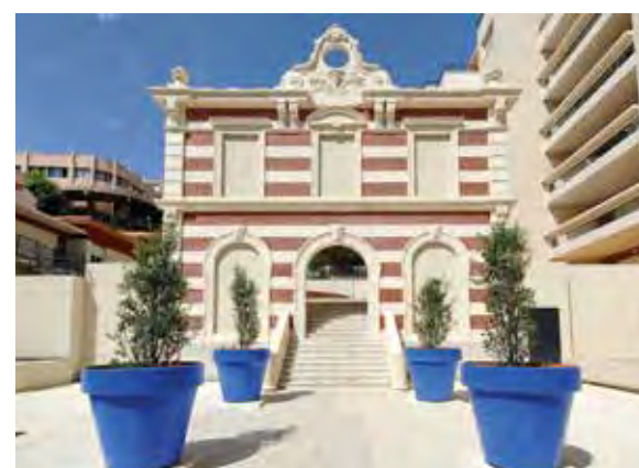
154 rue Breteuil - Marseille 6 e