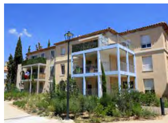
Le Domaine des Cyprès - Allauch Les Tourres