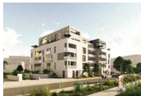
Les Hauts Romanets - Saint-Herblain