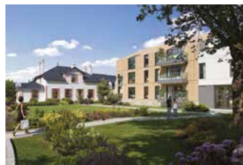
Le Domaine Saint-Michel - Guérande