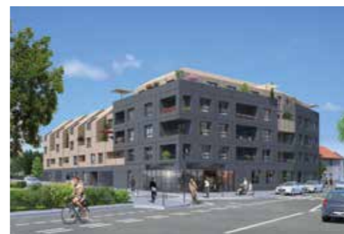
Gingko - Nantes