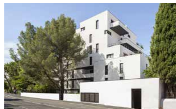
La Canopée - Montpellier Architecte : Samantha Dugay