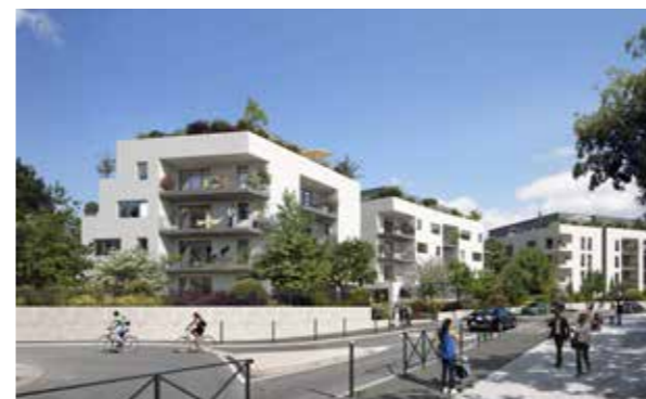
Le Domaine des Hirondelles - Montpellier Architecte : Serrado Architecture