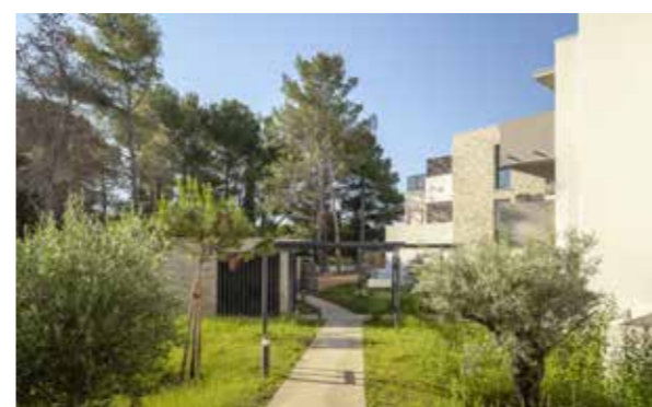
Villa des Grèzes - Montpellier Cabinet Imagine Architecture