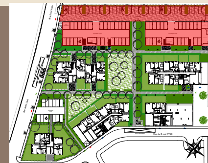
Rue Saint Louis 78955 CARRIERES SOUS POISSY (Ilot 2)