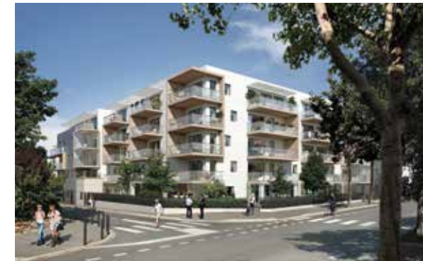
Le Jardin des Beaux Arts - Montpellier Architecte : Antoine Soler