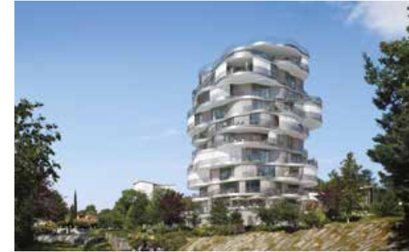
Folie Divine - Montpellier Architecte : Farshid Moussavi