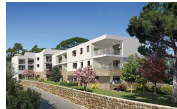
Cœur Castelnau - Castelnau-le-Lez Architecte : EXO 7