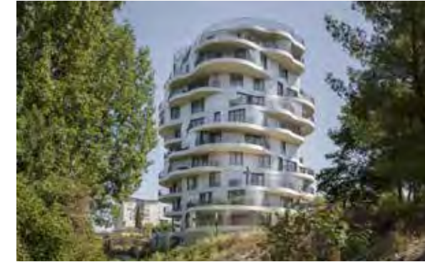
Folie Divine - Montpellier Architecte : Farshid Moussavi