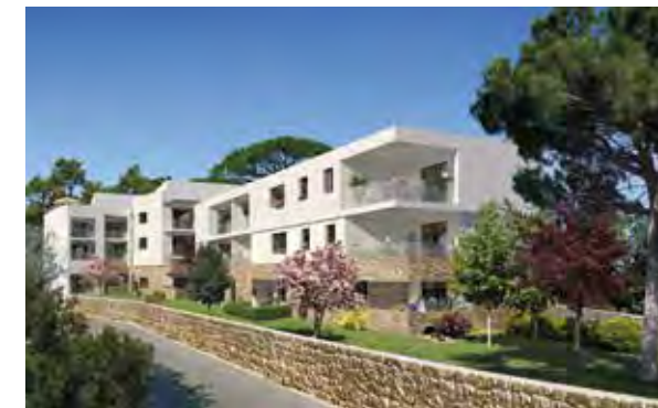
Cœur Castelnau - Castelnau-le-Lez Architecte : EXO 7