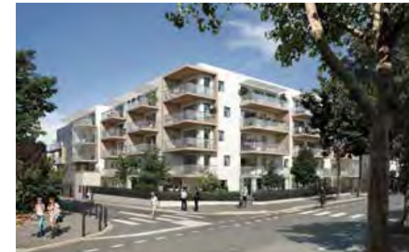
Le Jardin des Beaux Arts - Montpellier Architecte : Antoine Soler