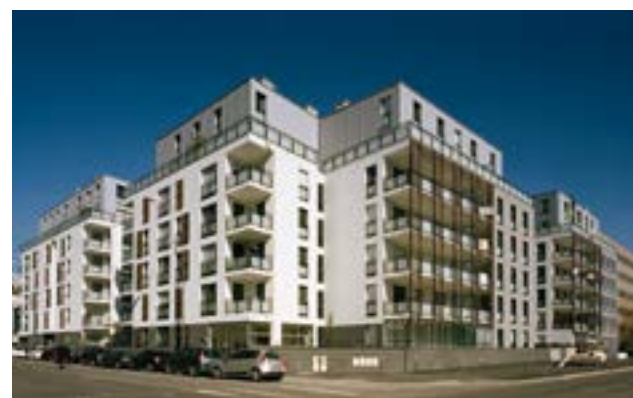
QUAI OUEST - LYON 9 ÈME Architecte : Sud Architectes