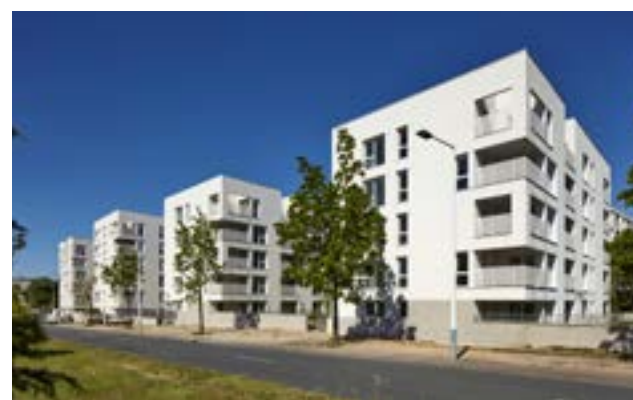
CITY GARDEN - VÉNISSIEUX Architecte : Cabinet Insolites Architectures