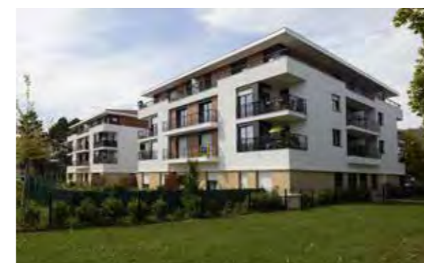
Villa du Mail - Gif-sur-Yvette Architecte : Hugues Jirou