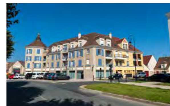
Tigery Village - Tigery Architecte : Xavier Bohl