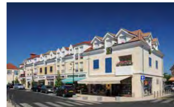
Les Allées Saint-Rémy - Draveil Architecte : Cabinet Elleboode