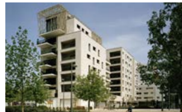
Confluence - Lyon 2 ème Architecte : Cabinet AFAA