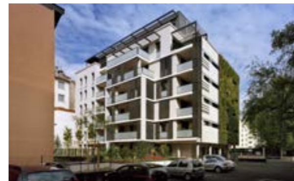
34 rue Lt. col. prévost - Lyon 6 ème Architecte : Atelier Thierry Roche