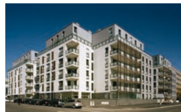
Quai Ouest - Lyon 9 ème Architecte : Sud Architectes