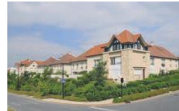
Chessy Village - Chessy Architecte : Lionel De Segonzac