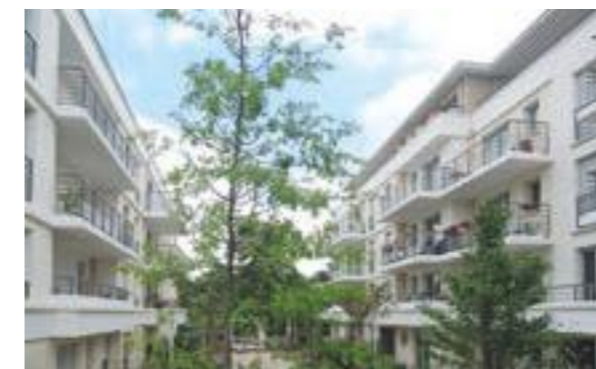
Les Jardins de Noisiel - Noisiel Architecte : Atelier GERA