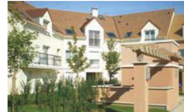
L'Orangerie - Chevry Cossigny Architecte : Mermet