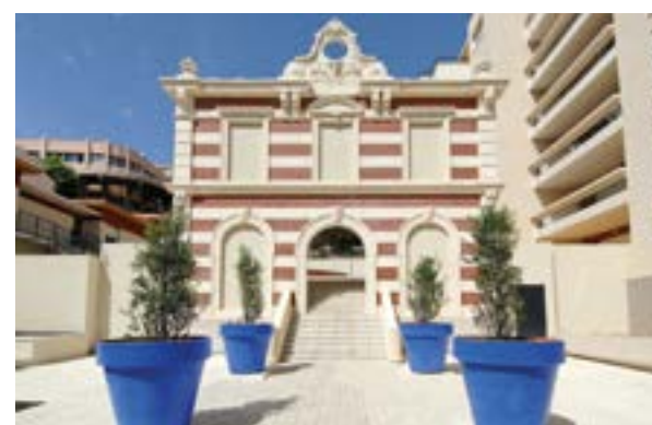
154 rue Breteuil Marseille 6 e