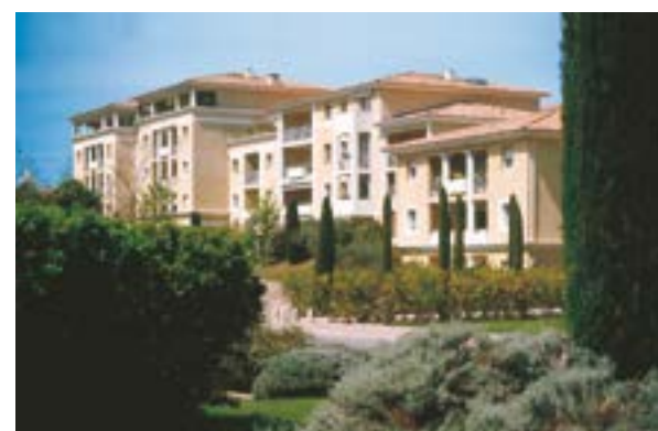
Parc de l'Amadour Aix-en-Provence