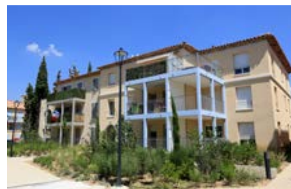
Le Domaine des Cyprès Allauch