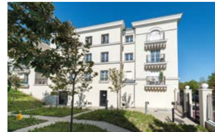
Le VI - Rueil-Malmaison