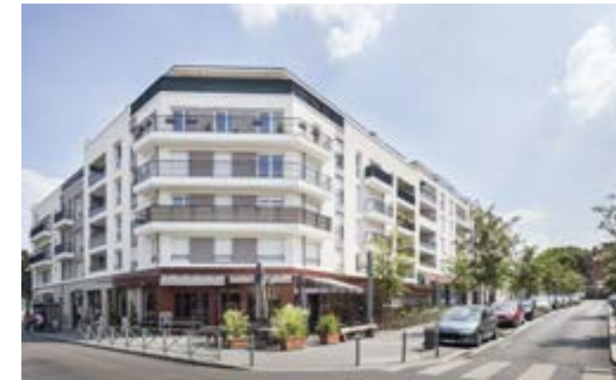
Carré Renaissance II - Bondy