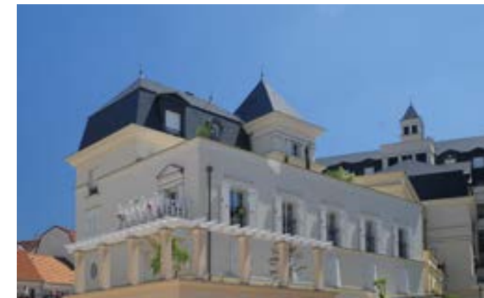
Palais Colbert - Le Plessis Robinson