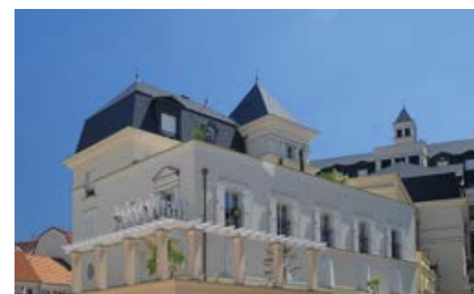
Palais Colbert - Le Plessis Robinson