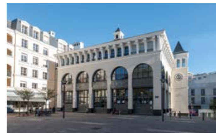
Grand Place - Chaville