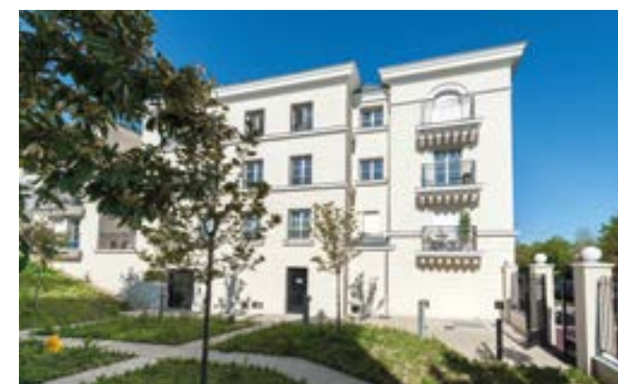
Le VI - Rueil-Malmaison