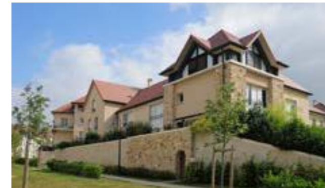
Chessy Village à Chessy (77) Architecte : Lionel de Segonzac