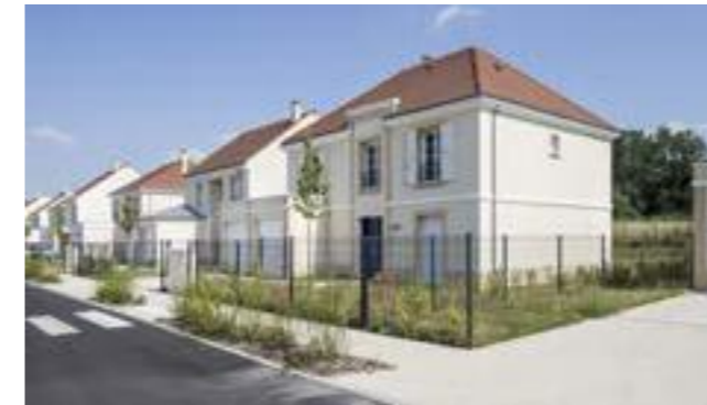
Domaine de l'Orangerie à Montevrain (77) Architectes : Emmanuel Gutel et Paul Meyer