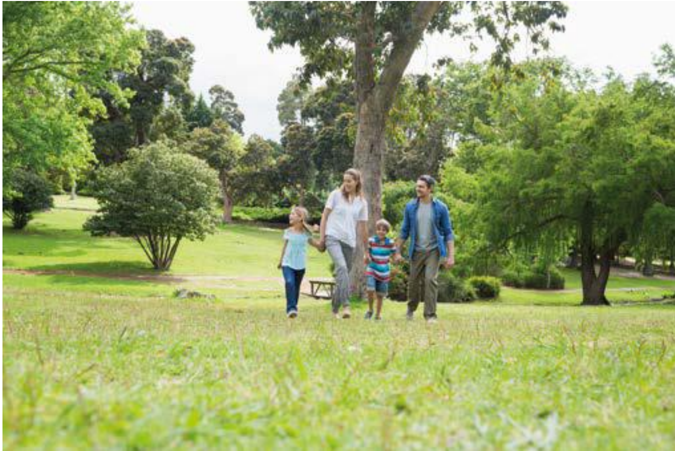
Le Mée-sur-Seine, une ville nature et dynamique au cadre de vie ressourçant