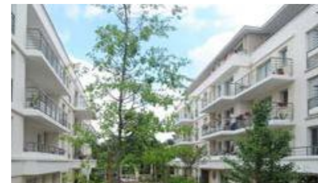
Les Jardins de Noisiel à Noisiel (77) Architecte : Atelier GERA