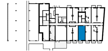
TABLEAU DES SURFACES (compris placards)