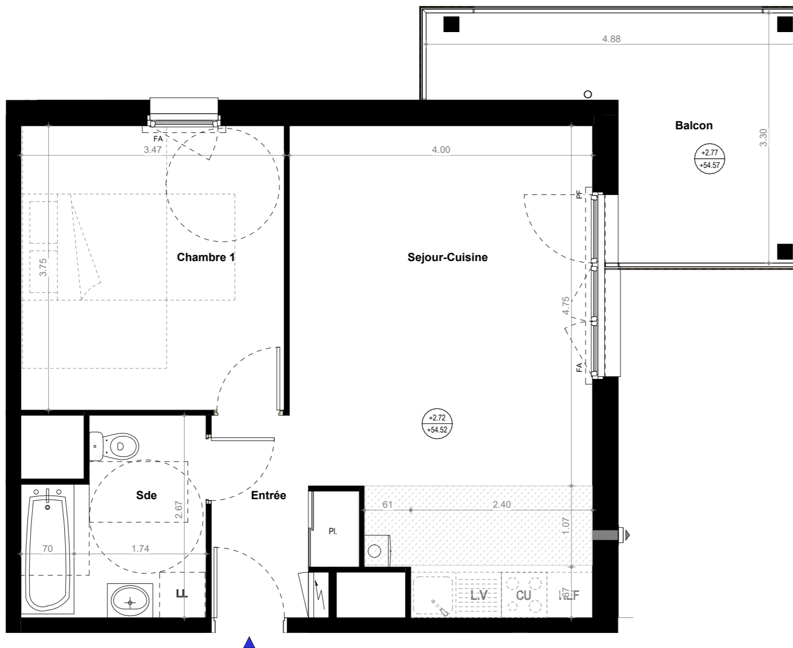
TABLEAU DES SURFACES (compris placard)