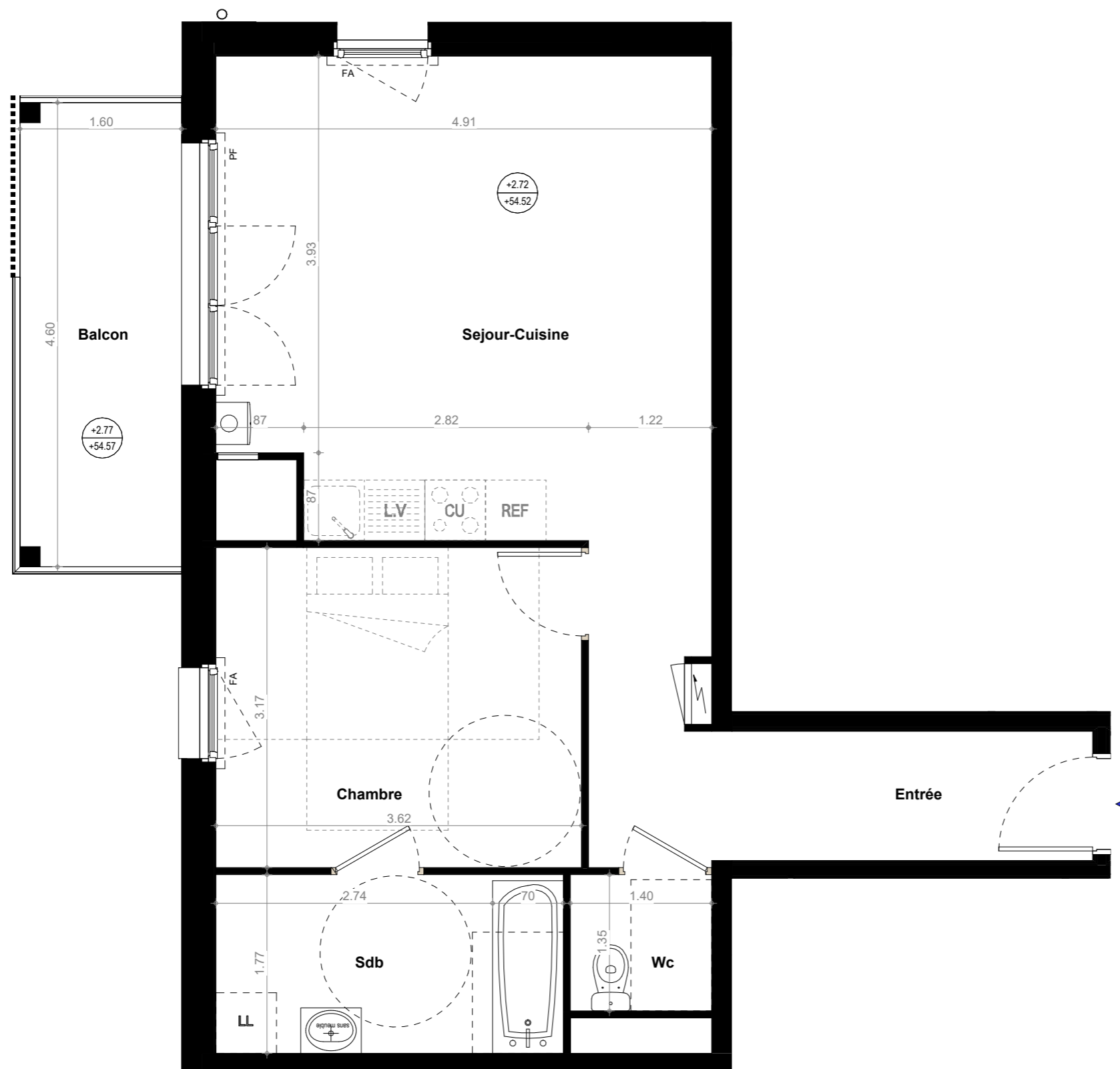
TABLEAU DES SURFACES (compris placard)