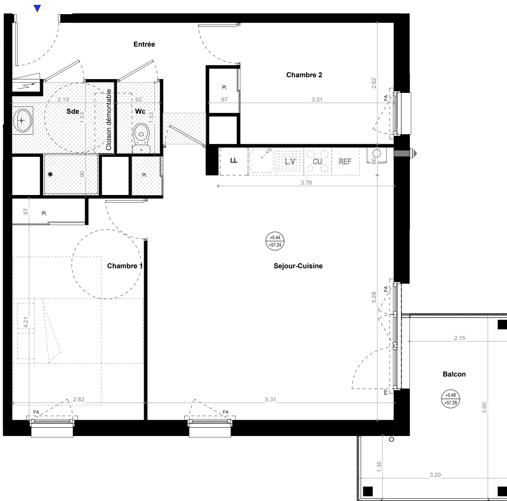
TABLEAU DES SURFACES (compris placard)