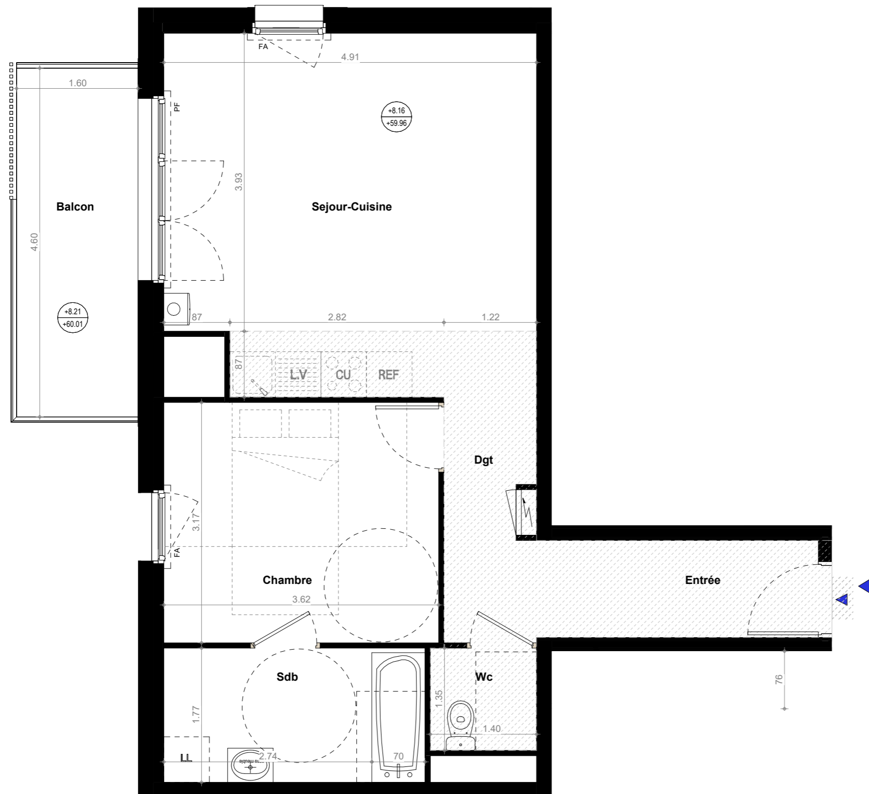
TABLEAU DES SURFACES (compris placard)