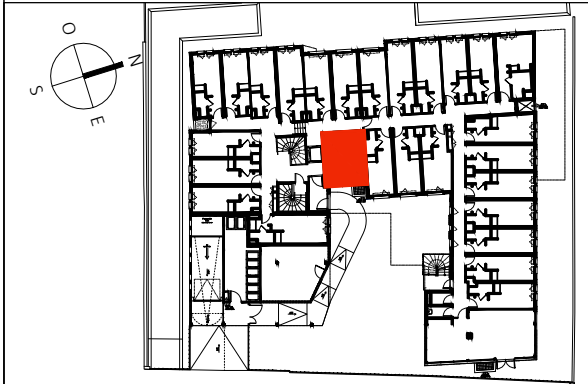
TABLEAU DES SURFACES (compris placards)

Plan des 4 Seigneurs 34090 Montpellier Appartement 1 PIECE Lot n° A027 BATIMENT A - Rez-de-Chaussée