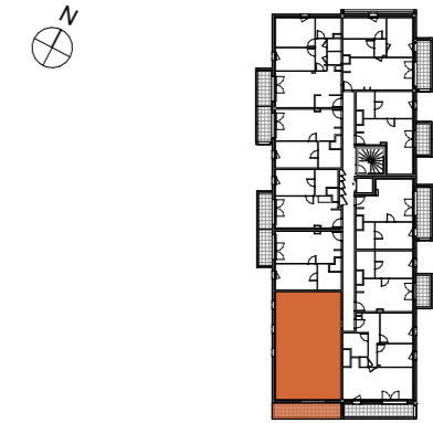
TABLEAU DES SURFACES (compris placard)

6 rue de la Mare Pavée 35235 Thorigné-Fouillard Appartement 4 pièces Lot n° 104 1er ETAGE