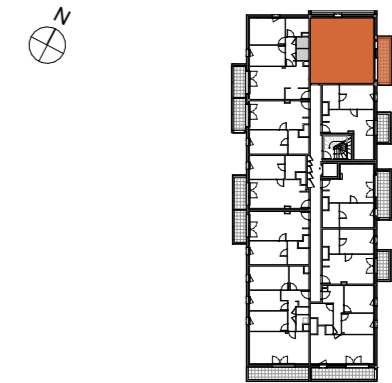
TABLEAU DES SURFACES (compris placard)

6 rue de la Mare Pavée 35235 Thorigné-Fouillard Appartement 3 pièces Lot n° 209 2ème ETAGE