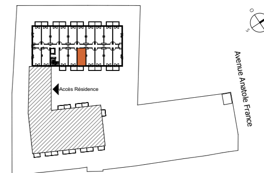
TABLEAU DES SURFACES (compris placards)