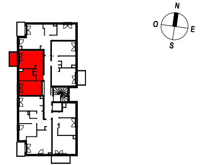
TABLEAU DES SURFACES (compris placards)