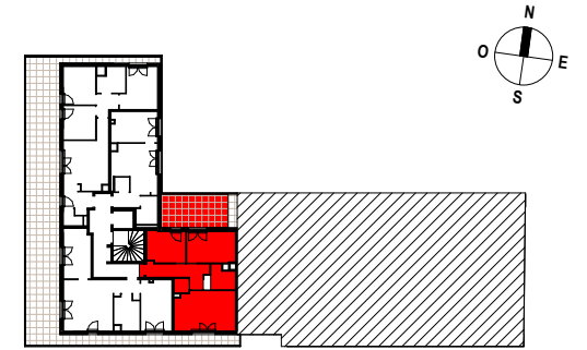
TABLEAU DES SURFACES (compris placards)