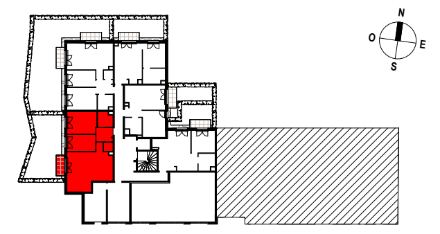
TABLEAU DES SURFACES (compris placards)

11-15 avenue Jean Jaures 78230 Le Pecq Appartement 3 PIECES Lot n° B01 BATIMENT B - REZ-DE-CHAUSSEE