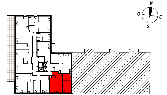
TABLEAU DES SURFACES (compris placards)