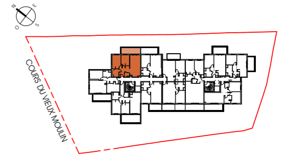
TABLEAU DES SURFACES (compris placards)

Appartement 3 pièces Lot n° A303 BATIMENT A - 3e étage