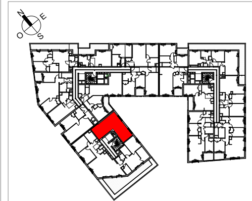
TABLEAU DES SURFACES (placards compris)