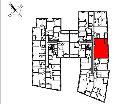
TABLEAU DES SURFACES (placards compris)