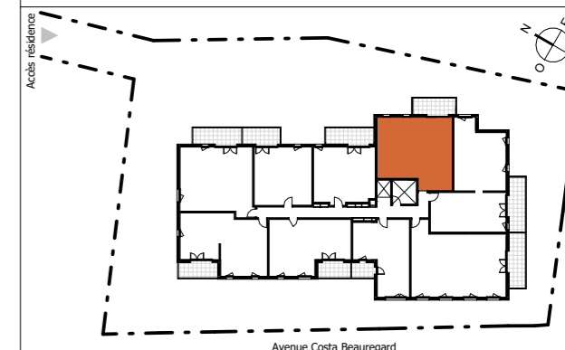
TABLEAU DES SURFACES (compris placards)

Avenue Costa de Beauregard Rue Charles Cabaud 73290 La Motte-Servolex Appartement 3 PIECES LOT n° 101 1er ETAGE