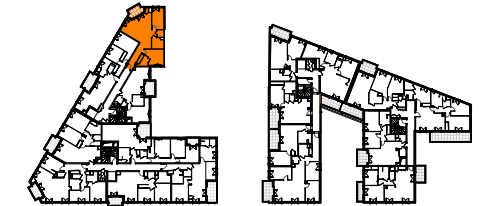
TABLEAU DES SURFACES (compris placards)