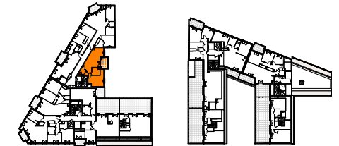
TABLEAU DES SURFACES (compris placards)