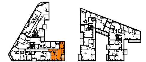
TABLEAU DES SURFACES (compris placards)