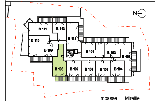
TABLEAU DES SURFACES (compris placards)

55 Impasse Mireille - 30000 NIMES Appartement 3 PIÈCES Lot n° B 108 BATIMENT B - PREMIER ETAGE