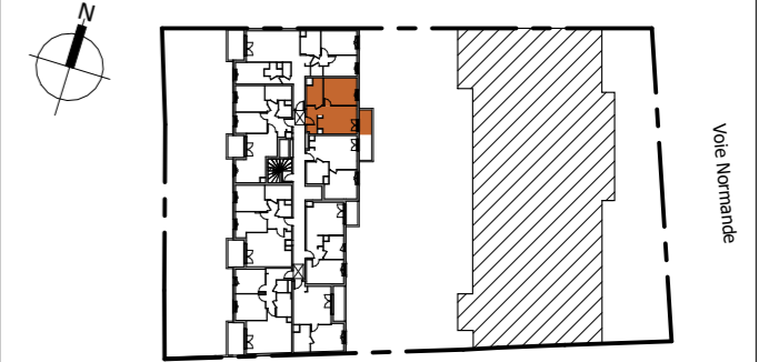
TABLEAU DES SURFACES (compris placards)